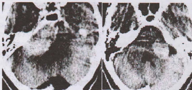
Рис. 1. А. менингиома с широкой зоной имплантации на ЗППВК справа. Б. невринома слухового нерва слева.

Изменения со стороны костных образований ЗЧЯ на КТ обнаруживались только при менингиомах ЗППВК. В 12,5% всех менингиом ЗППВК костные изменения в виде деструкции вершины пирамидки височной кости (2 наблюдения), расширение внутреннего слухового прохода (2 наблюдения или 4,1%) и также в 2